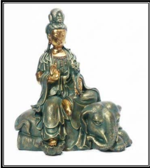
NAM MÔ ĐẠI HẠNH PHỔ HIỀN BỒ TÁT